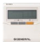
UTY-RNNGM standaard voor type AR12-60, AU30-54, optioneel voor type AU12-24 en AR72-90.