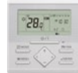
UTY-RLRG standaard voor type AR72-90RIYF.